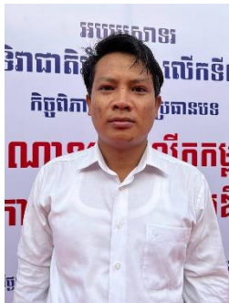
ជ័យលាភីលេខ ២

ជ័យលាភី បេក្ខជនបកស្រាយ ប្រធានបទ ក្នុងកម្មវិធីទិវាជាតិអំណានលើកទី៧ ១១ មីនា ២០២២