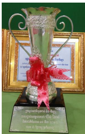
( ពានរង្វាន់លេខ ២ )