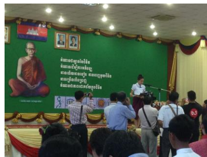
( រូបថតតំណាង បេក្ខជនជ័យលាភីស្នូតកំណាព្យ និងអានអត្ថបទ )