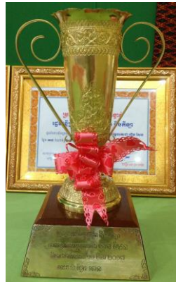
( ពានរង្វាន់លេខ ១ )