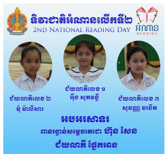
ជ័យលាភីអានអត្ថបទ