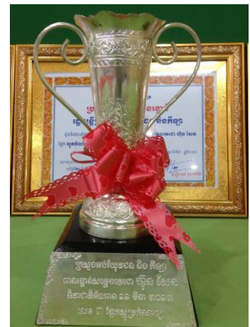
( ពានរង្វាន់លេខ ៣ )