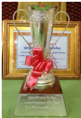
( ពានរង្វាន់លេខ ២ )