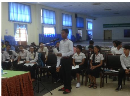
( រូបថតតំណាង បេក្ខជនស្នូតកំណាព្យ )