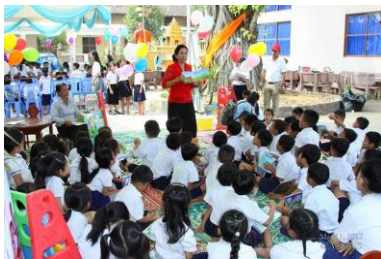
( សកម្មភាពកុមារ )