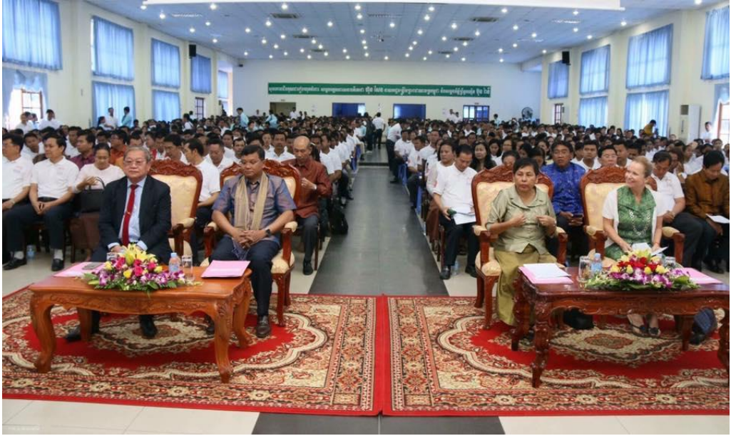
សមាសភាពក្នុងពិធីទិវាជាតិអំណាន ១១ មីនា ២០១៧ ( សូមមើលតារាងទី៧ ក្នុងឧបសម្ព័ន្ធ ស្តីពី សមាសភាព និងចំនួនអ្នកចូលរួមក្នុងពិធី )