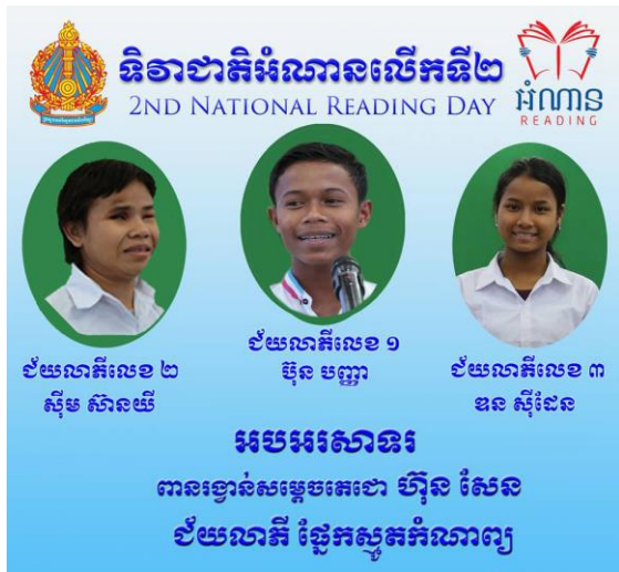
ជ័យលាភីស្នូតកំណាព្យ