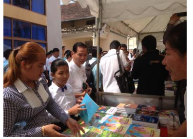
( សកម្មភាពថ្នាក់ដឹកនាំក្រសួងអប់រំ យុវជន និងកីឡា )