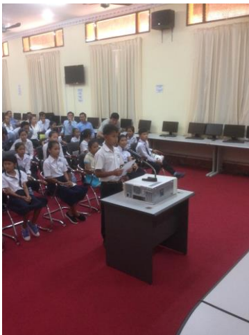
( រូបថតគំណាង បេក្ខជនអំណាន )