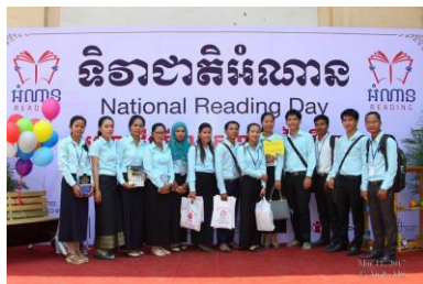
( សកម្មភាពថតរូបរបស់អ្នកចូលរួម )