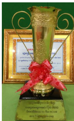
( ពានរង្វាន់លេខ ១ )