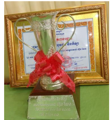
( ពានរង្វាន់លេខ ៣ )