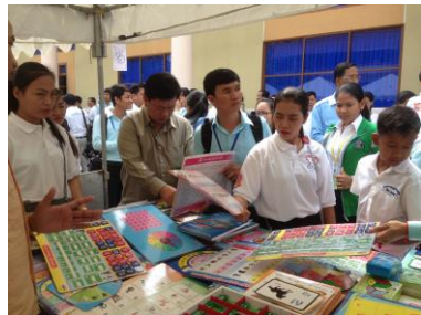
( សកម្មភាពថ្នាក់ដឹកនាំក្រសួងពាក់ព័ន្ធ និងអ្នកចូលរួម )