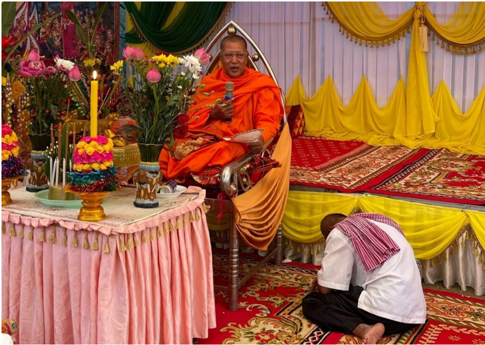
ព្រះសង្ឃសម្តែងធម៌ទេសនាអប់រំពុទ្ធបរិស័ទក្នុងពិធីបុណ្យចម្រើនព្រះជន្ម (ស្រុកកងមាស ខេត្តកំពង់ចាម)