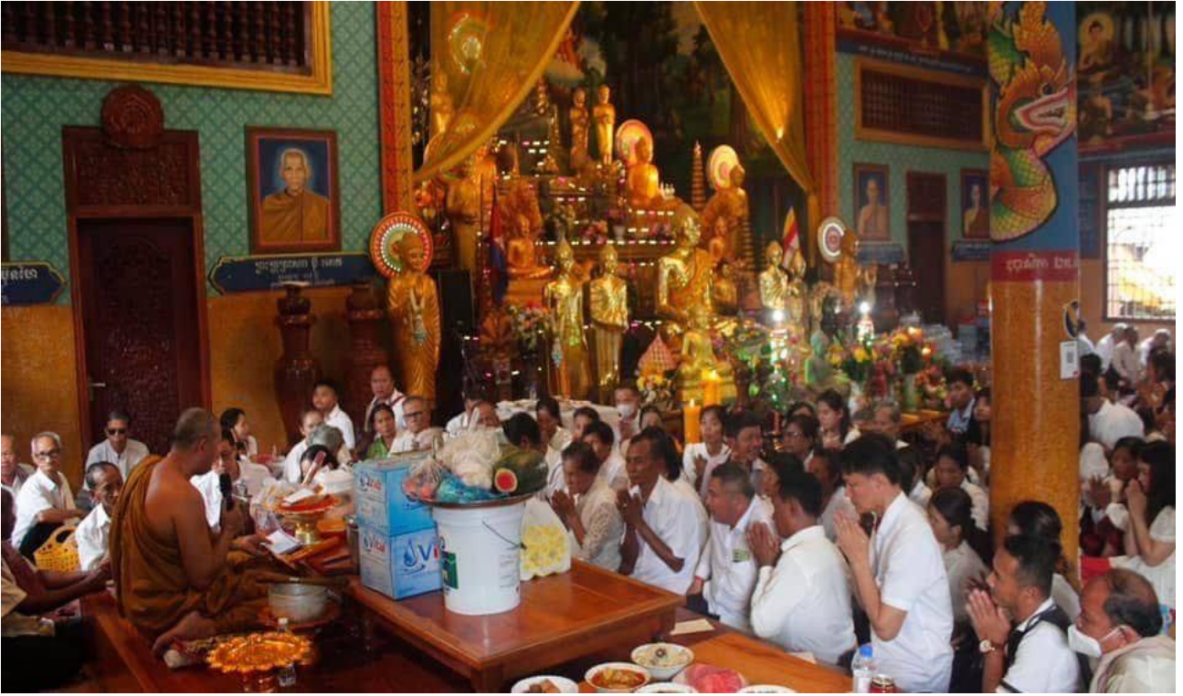
ប្រជាពលរដ្ឋខ្មែរជួបជុំគ្នាធ្វើបុណ្យនៅតាមទីវត្តអារាមប្រកបដោយសទ្ធាជ្រះថ្លា (វត្តអម្ពវត្សារាម ហៅវត្តស្វាយតាហែន ស្រុកកងមាស ខេត្តកំពង់ចាម)