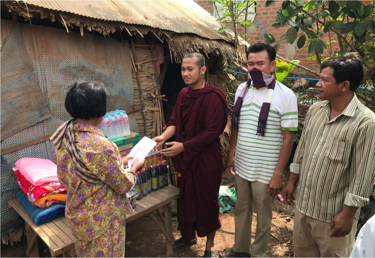
ព្រះសង្ឃផ្តល់គ្រឿងឧបភោគបរិភោគ និងថវិកាដល់ជនក្រីក្រ (ស្រុកកងមាស ខេត្តកំពង់ចាម)