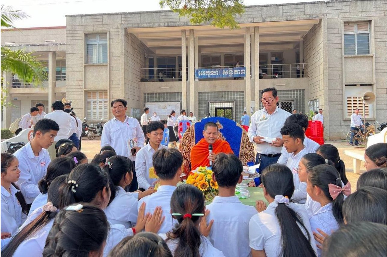
ការសម្តែងធម្មទេសភាពអប់រំសីលធម៌សង្គម និងឥរិយាបថយុវជនប្រកបដោយសីល សមាធិ បញ្ញា នៅវិទ្យាល័យពោធិ៍សាត់ (ប្រកាសភាព MoEYS Cambodia)