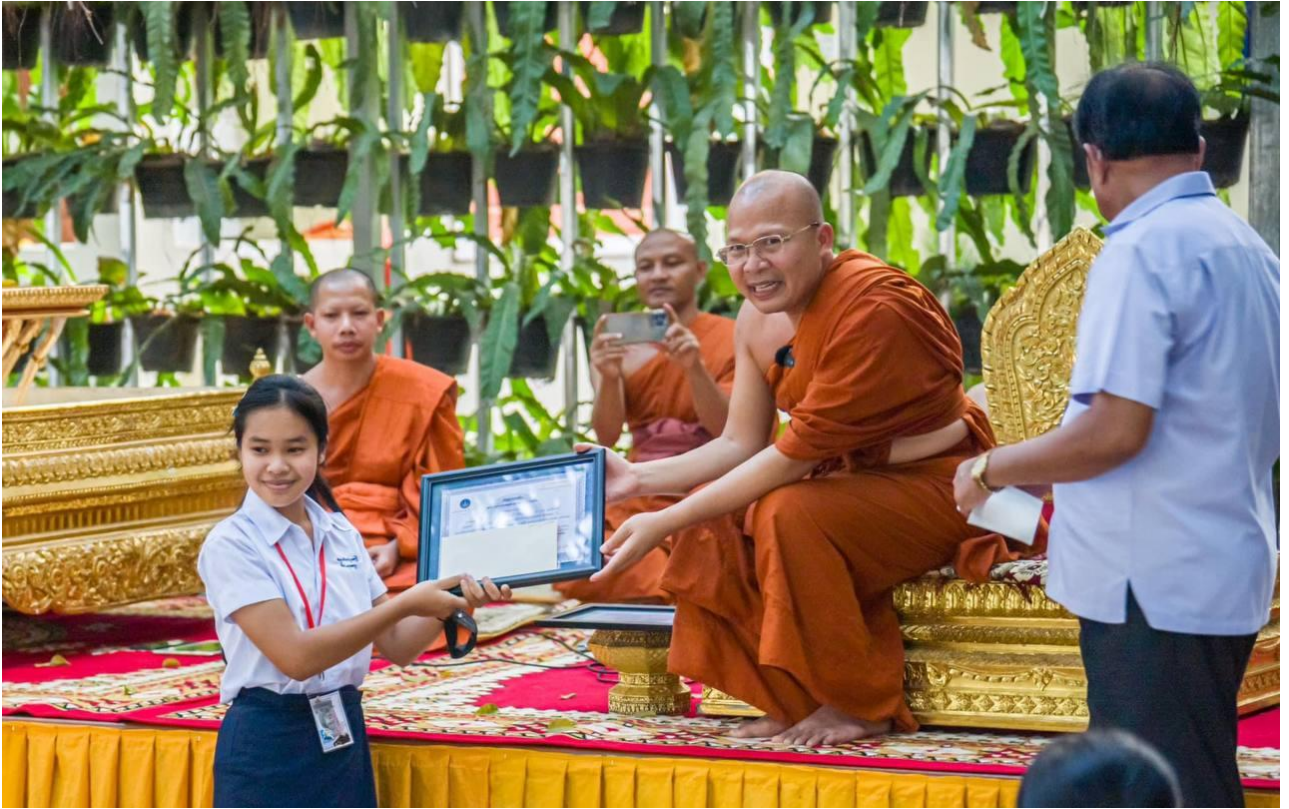
សិស្សានុសិស្សចូលរួមប្រឡងចំណេះដឹងព្រះពុទ្ធសាសនាអំពីបុណ្យមាយបូជា