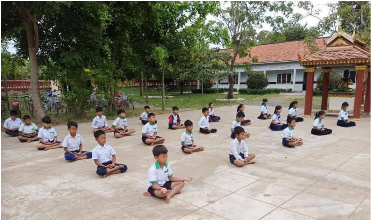
សិស្សានុសិស្សសាលាបឋមសិក្សាអង្គរបាន ជំនាន់ថ្មី ធ្វើសមាធិក្រោយគោរពទង់ជាតិ និងមុនម៉ោងសិក្សា (ស្រុកកងមាស ខេត្តកំពង់ចាម)