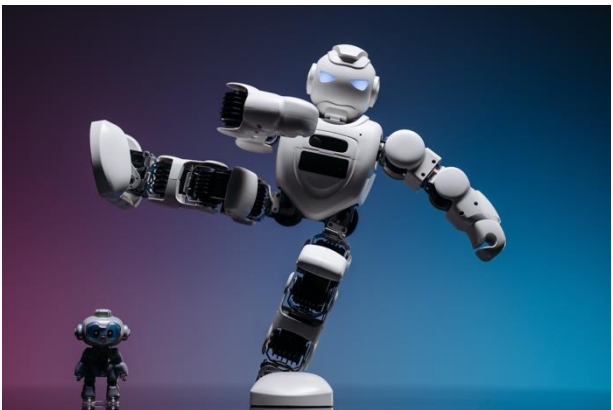
(រូបភាពតំណាង) របត់បដិវត្តន៍ឧស្សាហកម្ម ៤.០ បច្ចេកវិទ្យាជួយឱ្យមនុស្សផ្តោតទៅលើការបង្កើតថ្មី និងគំនិតច្នៃប្រតិដ្ឋ (នវានុវត្តន៍)។