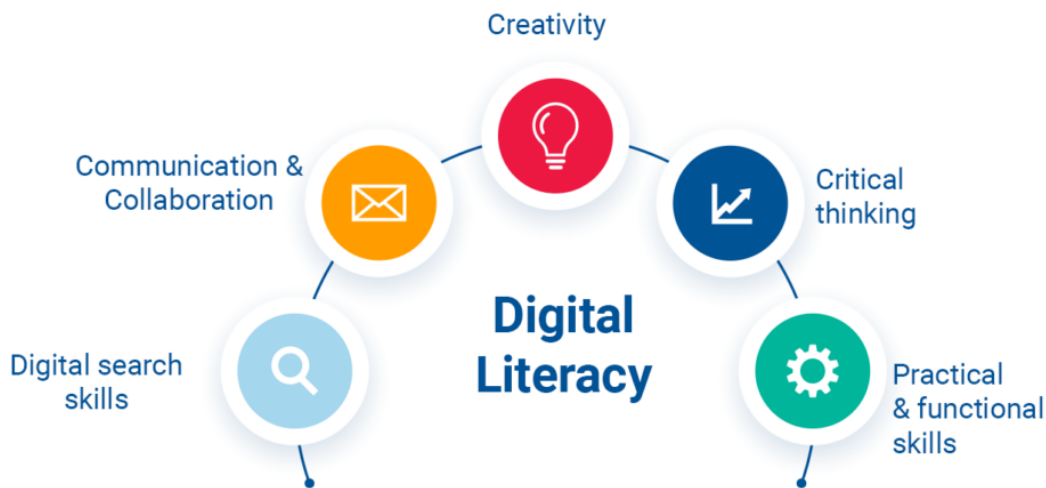
បំណិនគោលទាំង៥ របស់អក្ខរកម្មឌីជីថល, រូបភាពដោយ SDI (Service Desk Institute), តំណភ្ជាប់រូបភាព ចុចទីនេះ !

ត្រង់ចំណុចនេះ អក្ខរកម្មឌីជីថល គឺជាបំណិនដែលចាំបាច់សម្រាប់ការសិក្សា ការរស់នៅ និងការបំពេញការងារនៅក្នុងសង្គមនៃសតវត្សទី២១ ដែលប្រើប្រាស់បច្ចេកវិទ្យាឌីជីថល ដូចជា វេទិកាអ៊ីនធឺណិត បណ្តាញសង្គម និងឧបករណ៍អេឡិចត្រូនិកចល័ត ។ 2