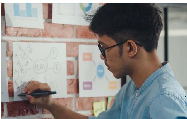
រូបភាពតំណាង ៖ ការបង្កើតផែនការផលិតមតិកាលើបណ្តាញសង្គមត្រឹមត្រូវ (អ្នកបង្កើតមតិកាផ្លូវការ)