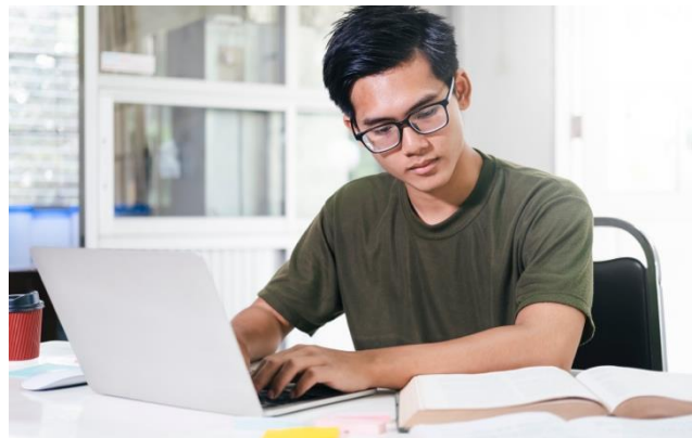
រូបភាពតំណាង ស្តីពីក្រុមសីលធម៌វិជ្ជាជីវៈផ្ទាល់ខ្លួននៅក្នុងអាជីព ។