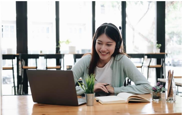
រូបភាពតំណាង ៖ របៀបទំនាក់ទំនង និងឥរិយាបថការងារនៅក្នុងសតវត្សទី២១

តាមរយៈការអប់រំសីលធម៌ផ្ទាល់ខ្លួន សីលធម៌វិជ្ជាជីវៈ និងសីលធម៌សង្គម នោះបុគ្គលអាចកសាង គុណតម្លៃផ្ទាល់បានយ៉ាងងាយនៅក្នុងយុគសម័យឌីជីថល ។