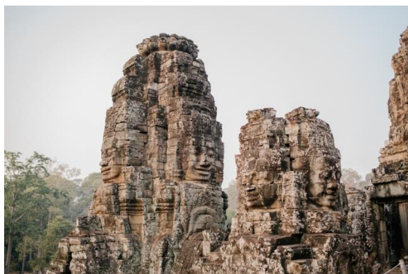
រូបភាពតំណាង ប្រាសាទអង្គរវត្ត និងប្រាសាទបាយ័ន ខេត្តសៀមរាប ។