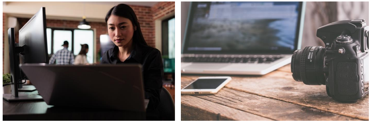
រូបភាពតំណាង ៖ ឧបករណ៍ផលិតមតិកាបណ្តាញសង្គម

ទី១ ការប្រើប្រាស់បណ្តាញសង្គមងាយស្រួល ៖ បណ្តាញសង្គមហ្វេសប៊ុក និង TikTok កំពុងមានប្រជាប្រិយភាព និងប្រើប្រាស់ទូលំទូលាយនៅកម្ពុជា។ បច្ចេកវិទ្យាទំនើប និងឧបករណ៍គាំទ្រសម្បូរបែបមនុស្សគ្រាន់តែមានលទ្ធភាពប្រើទូរស័ព្ទស្មាតហ្វូនថតរូប ថតវីដេអូ ឬក៏អាចបង្កើតមតិកាមួយបានដោយងាយ។ ថ្វីត្បិតងាយស្រួលបង្កើតមតិកាក៏ពិតមែន ប៉ុន្តែមិនប្រាកដថា មតិកានោះមានក្រមសីលធម៌ ឬគោរពដល់តម្លៃអ្នកដទៃឡើយ។ នេះជាហេតុផលធ្វើឱ្យគុណតម្លៃផ្ទាល់ខ្លួនរបស់បុគ្គលធ្លាក់ចុះតាមរយៈការប្រើប្រាស់ឌីជីថល ។