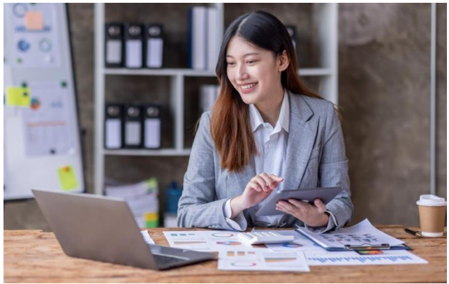
(រូបភាពតំណាង) មធ្យោបាយសិក្សាក្នុងយុគសម័យឌីជីថល ។

សីលធម៌ផ្ទាល់ខ្លួនអាចរៀនបានពីមនុស្សជុំវិញខ្លួន ការអានសៀវភៅ វីដេអូអប់រំ សំឡេងព័ត៌មាន និងតាមរយៈការជួបជុំក្នុងពិធីផ្លូវការអ្វីមួយ។ ការអនុវត្តមេរៀនសីលធម៌ផ្ទាល់ខ្លួន ជាការផ្តល់ឱកាសឱ្យខ្លួនទទួលបានការអប់រំពេញមួយជីវិត។ ការរៀនសូត្រពេញមួយជីវិត (Lifelong Learning) ជារបៀបសិក្សាថ្មីមួយមិនឱ្យខ្លួនឯងជាប់គាំងនឹងកម្រិតចំណេះដឹងដែលមានពីអតីតកាល។